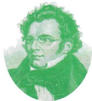
Franz Peter Schubert (1797~1828 オーストリア)

戯曲が失敗に終わったので、シューベルトも総譜を戸棚の奥深く放り込んだまま世に出そうともしなかったが、シューベルトの死後40年ほどたってシューマンが発見し、1867年グローヴとサリヴァンによって公表されたのである。『ロザムンデ』の台本は散逸してしまい、現在は音楽だけが残っている。しかしシューベルトの音楽は、初演当時から好評をもって迎えられたのは事実であり、現在でも部分的にはたびたび演奏されている。