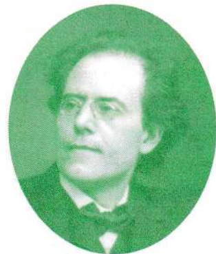
Gustav Mahler (1860~1911 オーストリア)