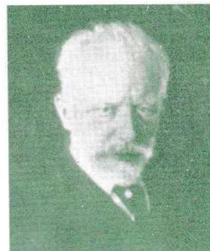
Petr I'lich Chaikovskii (1840~1893 ロシア)

冒頭はホルンとファゴットによるファンファーレ風な主題で始まるが、チャイコフスキーはこの主題について「これは運命です。幸福の希望を妨げる冷酷な力です。諦め、嘆き悲しむしかありません」と記してある。(このことより、チャイコフスキーの『運命』交響曲と呼ぶこともある。)