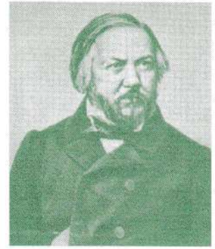
Mikhail Ivanovich Glinka (1804~1857 ロシア)