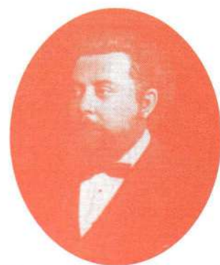
Modest P. Moussorgsky (1839～1881 ロシア)

キエフの大門 ：力強い堂々たる旋律から始まり、ついで、宗教的な旋律が2回繰り返されてから、寺院の鐘の音と「プロムナード」が奏され最後に冒頭に現れた旋律によってクライマックスを迎え力強く曲を結ぶ。